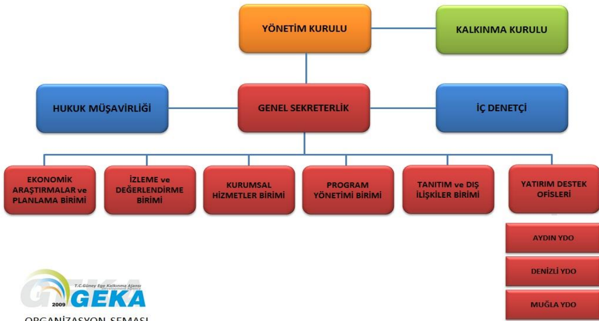
Şekil 2. Organizasyon Şeması