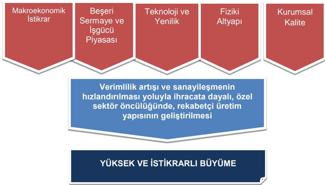
Şekil 5: 10. Kalkınma Planı Büyüme Stratejisi